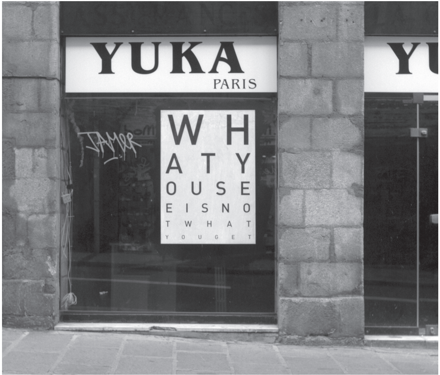
Mathieu Tremblin. « What You See Is Not What You Get », série Optical Protest . 2009. Rennes (FR).