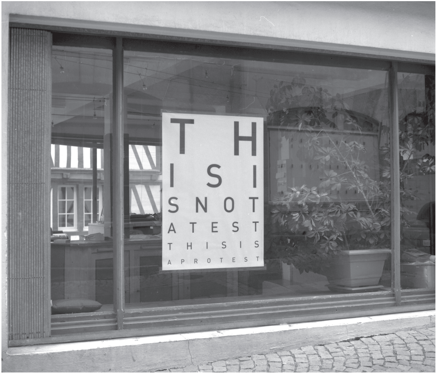
Mathieu Tremblin. « This Is Not A Test This Is A Protest », série Optical Protest . 2009. Morlaix (FR).