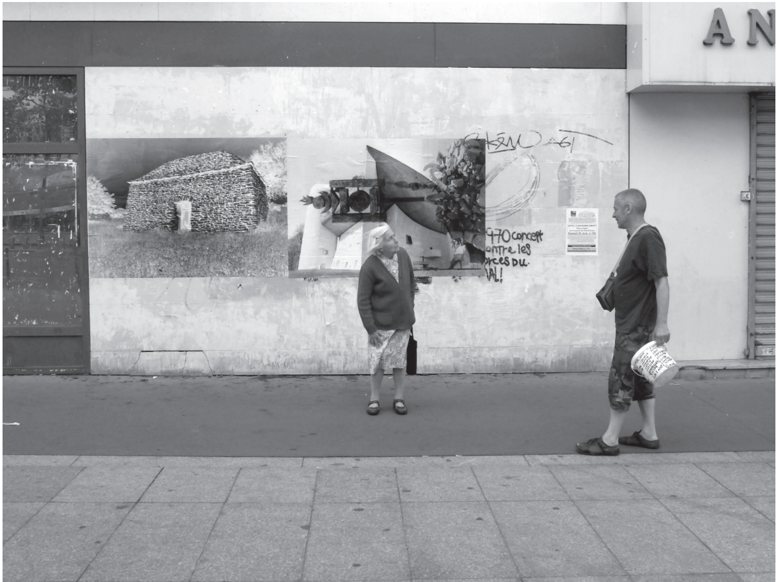
Antonio Gallego. Série Rituels ordinaires . 2015. Paris (FR).