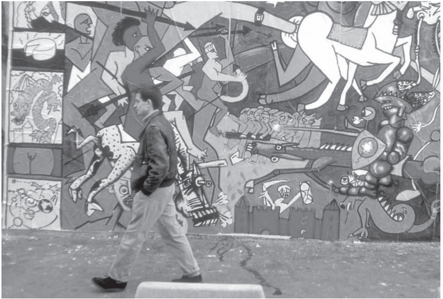
Banlieue-Banlieue. 1985. Aubervilliers (FR).