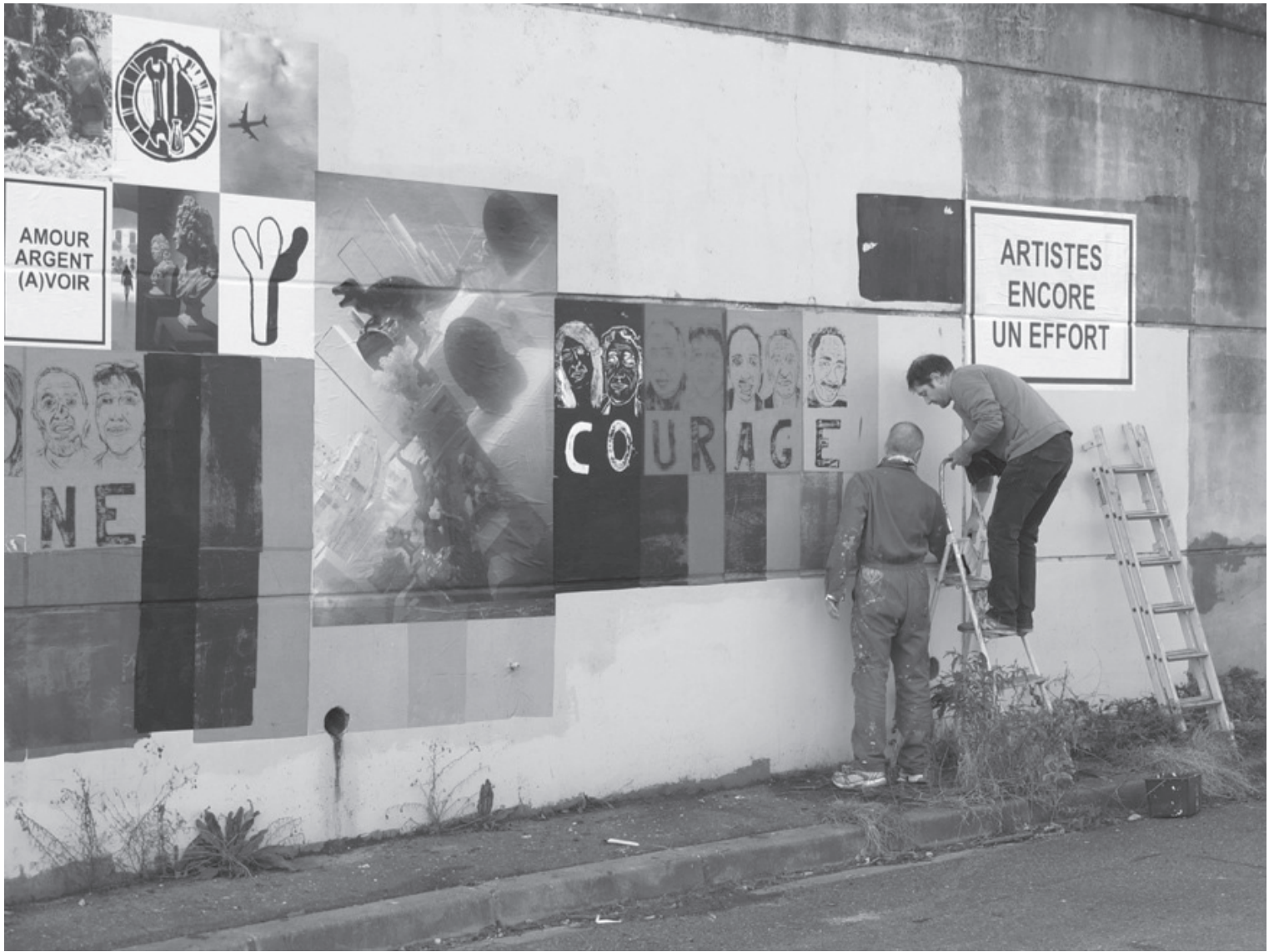
UN NOUS. Collage dans le cadre de « Populaire populaire #3 ». 2014. Saint-Denis (FR).